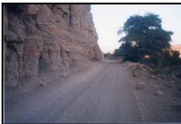
CARRETERA A CANDARAVE CONEXIÓN CON EL EJE INTEROCEÁNICO HACIA DESAGUADERO (PUNO) Y LA PAZ (BOLIVIA)

2.3.10 Pérdida progresiva de valores en algunos segmentos poblacionales.