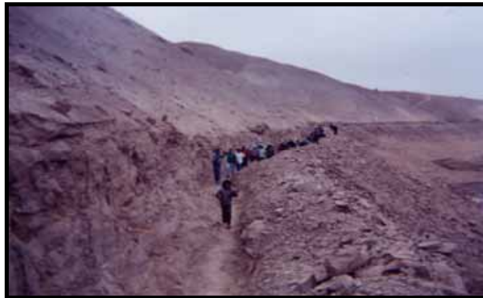
INICIOS DE CONSTRUCCIÓN CANAL DE IRRIGACIÓN EN PAMPA SITANA EFECTUADO POR LA POBLACIÓN CON RECURSOS PROPIOS

Se propulsará un sentido coherente y consensado de entender el desarrollo no desde un enfoque esencialmente constructivista “donde mejor gobierno hace quien más paredes construye”, sino que en coordinación y coparticipación se desarrollen aquellas obras de necesidad esencial para el desarrollo de la comunidad.