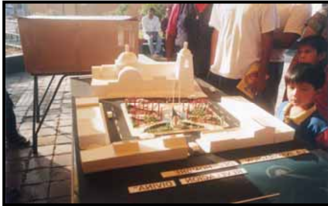
VISION DE FUTURO PARA EL ORDENAMIENTO URBANO