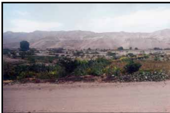
VALLE DE CINTO ANTIGUA DESPENSA FRUTICULA DEL SUR. DEMANDA IMPULSO PRODUCTIVO

En este contexto las tendencias por parte de los niveles de participación institucional presentan parciales formas y contenidos por verdaderamente promover la actividad productiva y comercial así, el ente rector, en el aspecto agropecuario, representado por el Ministerio de Agricultura a través de la Agencia Agraria de Jorge Basadre - Locumba, presenta un escaso o mínimo rol participatorio, carentes de planes y programas, con escaso presupuesto y con un personal calificado mínimo, poco o nulo es su nivel de representatividad, adhiérase a ello un improductivo proceso de elaboración y promoción de proyectos aprobados por el sector, su escaso nivel de negociación ante las fuentes del Sistema Nacional de Inversiones y menos aun ante las fuentes cooperantes externas, agréguese a ello una incipiente relación ante los organismos públicos de asistencia técnica nacional e internacional. Otros sectores vinculados al componente productivo tienen un escaso nivel participatorio.