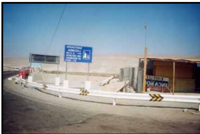
VIA DE INGRESO AL CENTRO POBLADO DE LOCUMBA