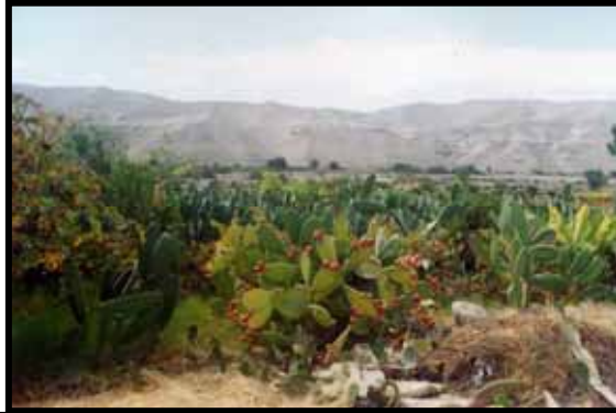
VISTA DEL VALLE DE CINTO EN PROCESO DE RECUPERACIÓN AGRÍCOLA Y SANEAMIENTO FÍSICO LEGAL