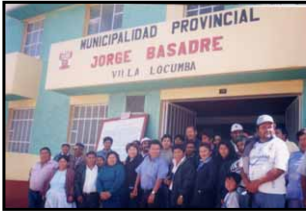
PARTICIPACIÓN COORDINADA Y CONCERTADA CON LOS ACTORES LOCALES Y LA MUNICIPALIDAD PROVINCIAL