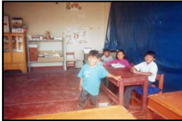
CAPITAL HUMANO FORTALECIMIENTO IMPORTANTE DE LA SOCIEDAD ALUMNOS EN EL VALLE DE CINTO

En cuanto al tema de salud integral, la población asumirá su responsabilidad y conciencia en tanto reconozca su importancia y su calidad, en ese sentido todo el esfuerzo se abocara a una fuerte campaña de sensibilización que induzca a los actores sociales a reconocer en forma permanente lo trascendente de este cambio de aptitud ante si mismos y la familia, esta debe ser una campaña permanente en el seno de cada unidad social. La prevención es el esfuerzo mayor y así evitaremos la pérdida de vidas humanas como la de madres gestantes, muertes por parto con mala atención, niños desnutridos y frustrados por impedimento físico, entre otras atenciones, que no fueran atendidas oportunamente.