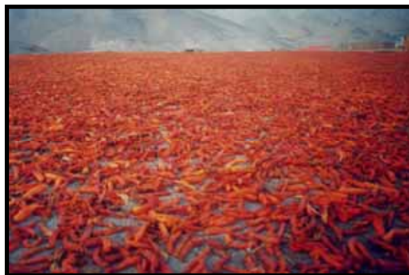
PRODUCCIÓN AGRÍCOLA ORIENTADA AL MERCADO LOCAL Y EXTERNO – ZONA DE PIÑAPA

En cuanto a la aplicación de esquemas agropecuarios, tendrá relevante participación el desarrollo de la actividad agrícola seguida de la ganadera, por su reconocida vocación y especialización productiva, las acciones tenderán a incorporar nuevos procesos adicionales productivos para que la producción de alimentos y de materias primas producidas por las familias sean objeto de mayor valor agregado que redunde en mejores precios y consecuentemente incremente los ingresos familiares.