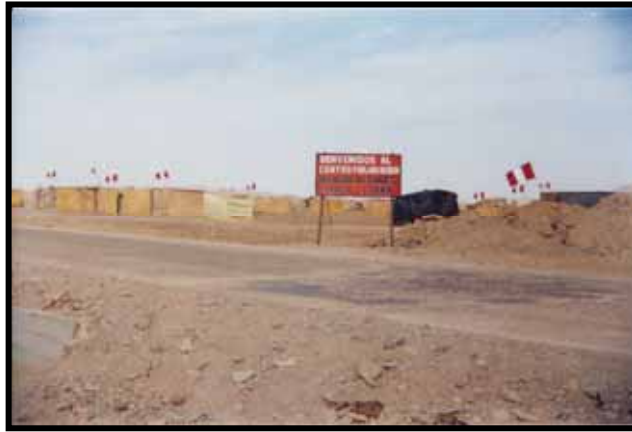
NUEVO CENTRO POBLADO DE PAMPA SITANA. EN LA CARRETERA CAMINO A TOQUEPALA

urbanos complementariamente considérese en ello la forma de abordamiento de los terrenos con superficie agrícola y de uso en aprovechamiento pecuario.