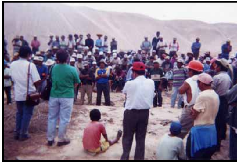
POBLACIÓN CON FORTALECIMIENTO ORGANIZACIONAL. PAMPA SITANA