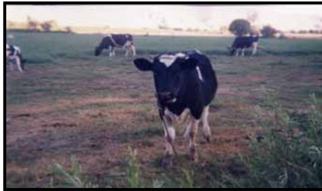
ACTIVIDAD PECUARIA CRIANZA DE GANADO VACUNO LECHERO. ZONA CHIPE