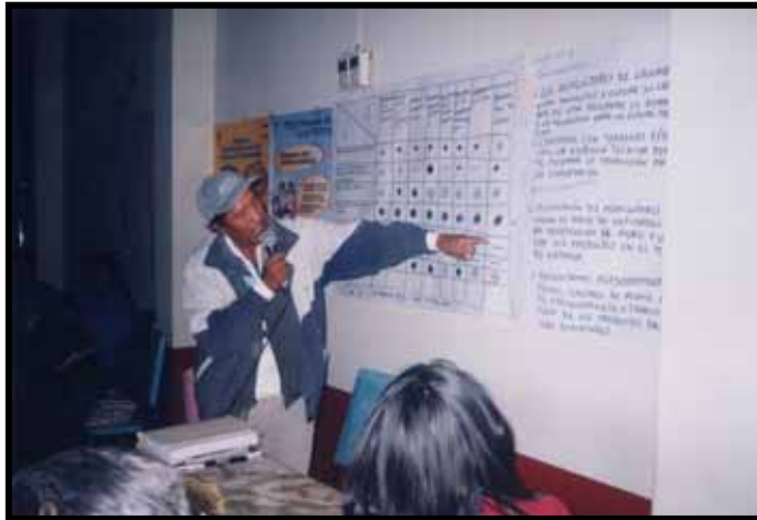
PRIORIZACIÓN DE LOS EJES ESTRATÉGICOS DE DESARROLLO POR LOS ACTORES LOCALES. REUNION DE LOCUMBA EN LA ELABORACIÓN DE SU PLAN ESTRATÉGICO MAYO 2003