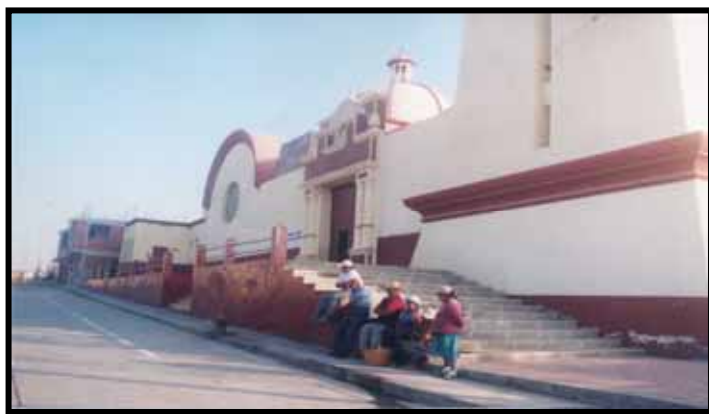
TEMPLO DEL SEÑOR DE LUCUMBA RECURSOS HISTORICO CULTURAL RELIGIOSO. VILLA LOCUMBA

Este salto migratorio hacia la faja costera y la replica de las familias originarias de Locumba con destino a los centros gravitacionales con mayor acondicionamiento en servicios como las ciudades de Tacna e Ilo configuran el nuevo escenario y contexto del espacio regional. El Distrito de Locumba fue creado políticamente el día 25 de Junio de 1855, mediante Ley N° 14799.