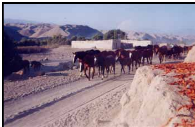
CRIANZA DE CABALLOS DE RAZA CLIMA FAVORABLE PARA SU DESARROLLO. ZONA DE CHIPE