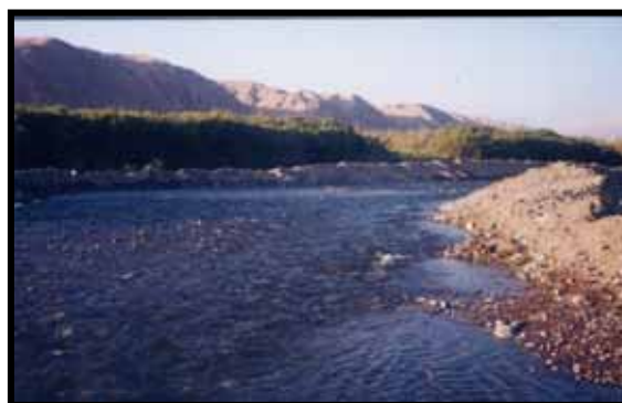
VISTA PAISAJISTICA DEL VALLE DE LOCUMBA

En segundo lugar, elevar el sentido de credibilidad institucional de los gobiernos locales y regionales esto amplia su capacidad de liderazgo, actuando de manera especial a fin de superar los actuales niveles de gestión y mejorar las imperfecciones del actual orden democrático, contando para ello con un modelo de gestión con participación ciudadana, el fortalecimiento de normas participativas, una cultura de política horizontal que reconozca la autonomía y diversidad de ciudadanos, y finalmente posibilitar las reglas del juego que incentiven las inversiones, creando un entorno competitivo mediante redes, cluster y sistemas de innovación.