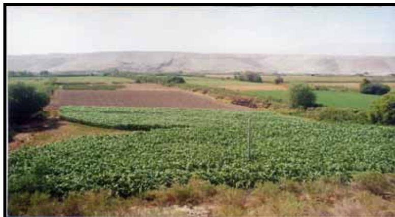
CULTIVOS AGRÍCOLAS VALLE DE LOCUMBA

Este recuento ha tomado en la actualidad un curso distinto, la información de la Agencia Agraria / OIA -Tacna en su Anuario Estadístico Regional, señala para el año 2000 la relevancia de solo siete productos entre ellos el ají (1144 TM), alfalfa (19170 TM), Cebolla (248 TM), maíz amiláceo (416 TM), maíz chala (6870 TM), maíz choclo (103TM), vid (160TM), según podemos detallar en el